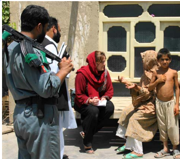
زن عودت کننده مشکلات خود را بازگو می کند

در بعضی محلات شما به اطفال خندانی بر میخورید که به آب آشامیدنی دسترسی ندارند، و مکتب رفتن برایشان به مفهوم دوساعت پیاده روی میباشد. در بعضی جاها تعجب میکنید که یک مرد چگونه فامیلش را کمک میکند درحالیکه هیچ شغلی ندارد. روز آینده درحالیکه در کنار کلکین نشسته و چای سبز مینوشد از نگرانش درمورد آینده سخن میگوید.