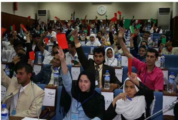
پارلمان جوانان در حال کار در کابل

بزرگترین چالش برای برنامه مشترک ملی جوانان افغانستان دانستن نیازهای جوانان و توانایی پاسخگویی به آن است. این موضوع مورد توجه هشت وزارت وهفت موسسه ملل متحد میباشد. هرگاه از افراد پرسیده شود که چه