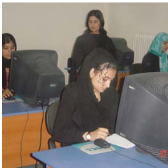
افغان ښځې د مزارشریف د معلوماتي ټیکنالوجی د روزنې په مرکز کې کمپیوټر زده کوي

د سیسکو د شبکې د اکاډمي پروګرام د برېښنايي زدکړې یو بل هر اړخیز پروګرام دی چې زده کوونکي د انټرنیټ پر هغو مهارتونو سمبالوي چې په نړیوال اقتصاد کې اساسي نقش لري. دغه اکاډمي د ویب پر بنسټ ولاړو معلوماتو، نېغ په نېغه ارزونې، د زده کوونکو د کارکردګي د څرک لګونې، د ښوونکو د روزنې او ملاتړ، او د صنعت د معیار د تصدیقونو لپاره د تیاری په برخه کې خدمتونه وړاندې کوي. نوموړي پروګرام له ۲۰۰۲م کال راهیسې د انټرنیټي شبکې ۴۱۴ مرستیالان فارغ کړي چې د سیسکو له خوا هم تصدیق شوي دي. ځینو فارغینو د افغانستان پنځو د شبکې، د فرانسې سفارت، د اقتصاد وزارت، د پروژې خدمتونو لپاره د ملګرو ملتونو دفتر (UNOPS)، انټرنیوز اجانس، کابل پوهنتون کې د معلوماتي ټیکنالوجی په مرکز، Global System International، د پنځو د چارو وزارت، د نړیوالې پراختیا لپاره د متحده ایالاتو ادارې، یونیفیم، د بهرنیو چارو وزارت، د افغان بیسیم شرکت، د ملګرو ملتونو پراختیایي